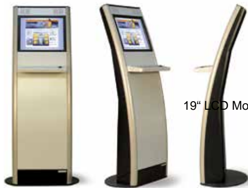
19" LCD Monitor mit Touch Screen

Diese Eagle Version ist für eine Vielzahl von Indoor-Anwendungen geeignet. Sie verbindet ein attraktives Design mit einer qualitativ höchstwertigen Ausführung. Der Eagle Standard ist der kleinste freistehende Kiosk in der Produktpalette und es ist möglich viele der am meisten nachgefragten kleineren Peripheriegeräte einzubauen.